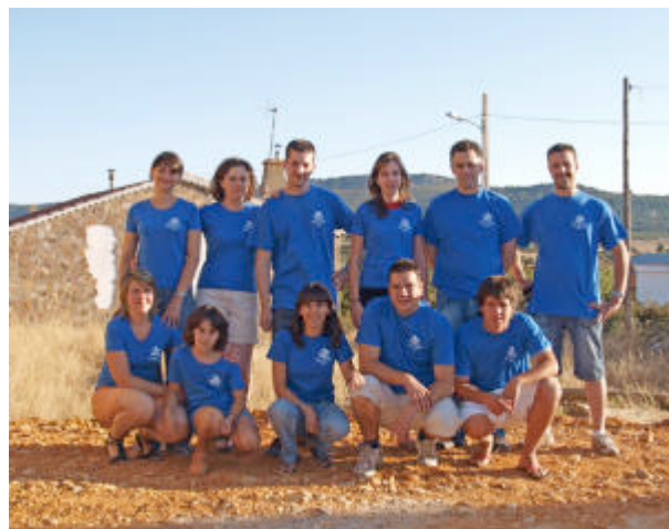
Integrantes de la Comisión de Festejos de Litos

Se califica a Litos como «un buen ejemplo a seguir», al ser conscientes de que parte del éxito de sus fiestas está en la organización y en la colaboración de la práctica totalidad de los vecinos. En Litos se creo con a tales fines la asociación recreativo cultural «Peña el Pilo», que cuenta con alrededor de 600 socios, y cada año el día 16 de agosto se elige una comisión que se encarga organizar los festejos del año siguiente. Las fiestas de Litos incluirán hoy la misa por los socios difuntos de la peña, la paellada, concursos de cartas de brisca y tute, representación teatral con el grupo «La Tijera» y verbena popular con el grupo Exceso. Para mañana esta prevista la misa y la procesión, homenaje al párroco Desiderio López Puent partido de fútbol en «La Ribera» entre Litos y Navianos de Valverde y verbena con el grupo Gaudí. Los festejo de Litos se sitúan entre los más afamados de la zona.